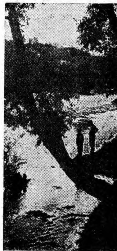
S-au dus zilele verii... Diminețile și serile sînt din ce în ce mai răco-roase. Săciile de pe malul Jiului sînt și ele parcă mai triste. Cei doi copii privesc nostalgic prin apa limpede cum e cristalinul jocul neas-impărat al păstrăvilor.

• Ora 15,30, stadion — A rîngolele întîlniri: P.F. Jiul: Jiul Petrița — A rîngole Lunea — C.F.R. rieșul Turda (fotbal — Simeria și Minerul Ani- categoria B); ora 13,45 noasa — Textila Sebeș.