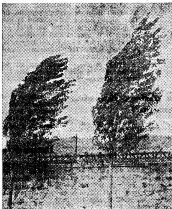
Vint de toamnă.

Zimbrul se îndreaptă cu precizie spre sud, condus parcă de o busolă. El este apăsnic, permite oamenilor să se apropie de el, acceptînd mîncarea ce i se oferă, primește chiar dulciuri din mîna copiilor. El se odihnește prin grajduri și staule în satele pe care le întîlnește în drum. Impins de instinctul său puternic, zimbrul va ajunge fără îndoială curînd la locul său de baștină.