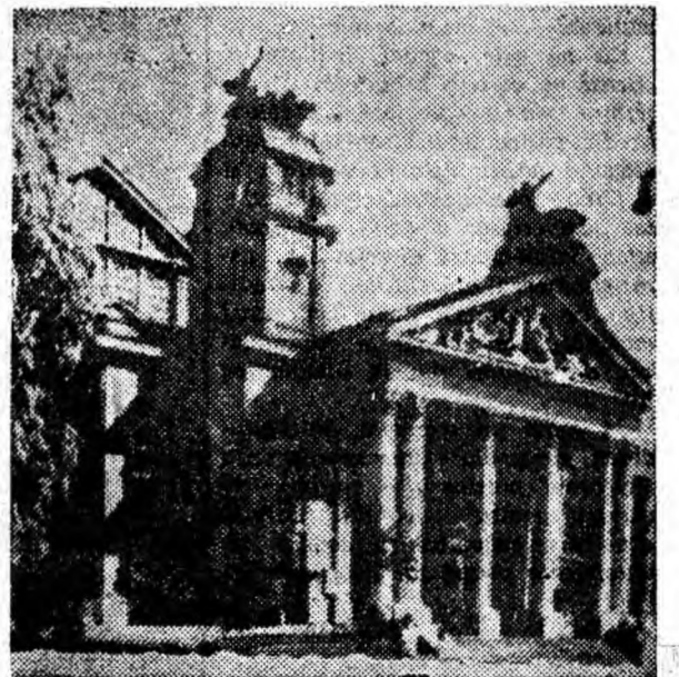
SOFIA — clădirea unui teatru.

Fenomenul se explică prin aceea că atunci cînd se consumă fructe acide, glandele secretă o cantitate mai mare de salivă care dizolvă și înlătură resturile alimentare rămase între dinți.