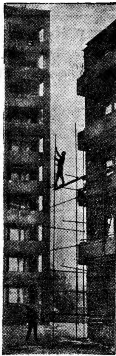
Paralele pe verticală.