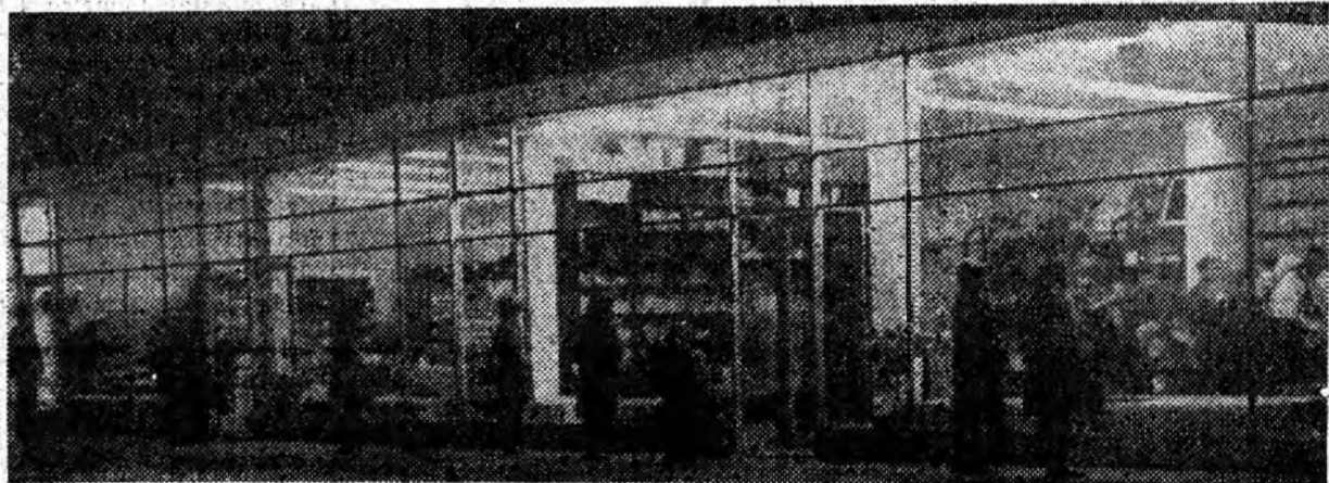
Aspect nocturn al complexului comercial din cartierul Livezeni—Petroșani.