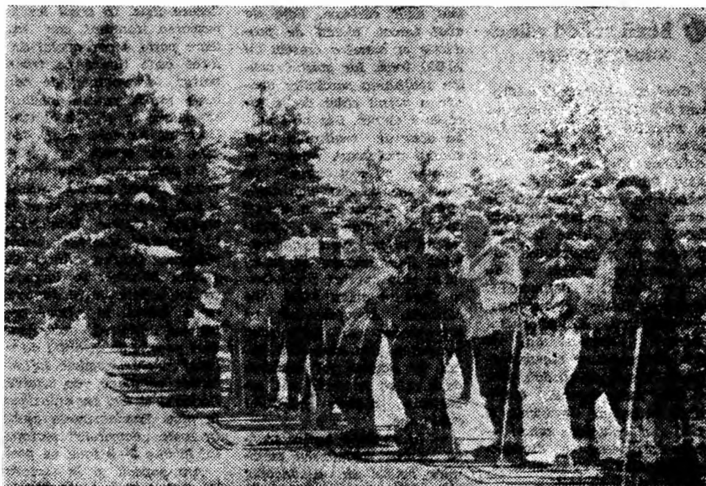
În așteptarea startului.

sportivi la Predeal, iar un alt lot, compus din cei mai mici schiori, a învățat tehnica schiului la Paring, unde cadrele de specialitate de la I.C.F. s-au ocupat de ei.