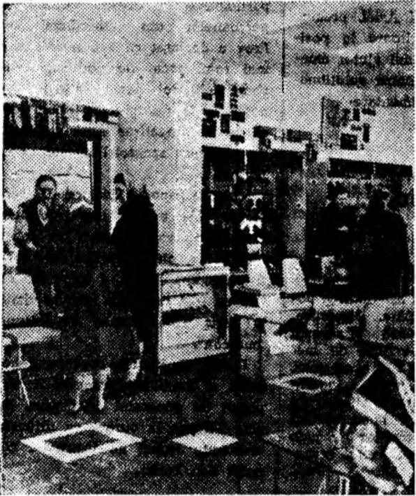
Aspect cotidian din magazinul de încălțăminte din cadrul Complexului din Livezeni-Petroșani.