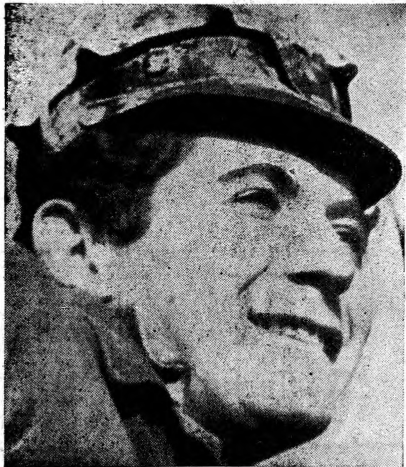
Înainte de șut.

◆ Lucrările Comitetului celor 18 de la Geneva ◆ Situația din Ghana. — Declarația generalului Ankrah ◆ Audierea vicepreședintelui S.U.A., Humphrey