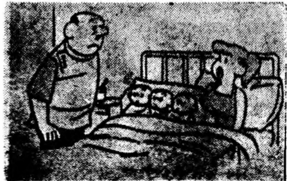
— Nu s-ar putea să nu-i arătați pe toți deodată soselele mele?

— Ceva mai bine, doctore. Dar abia acum am înțeles de ce plîng șagării atît de mult.