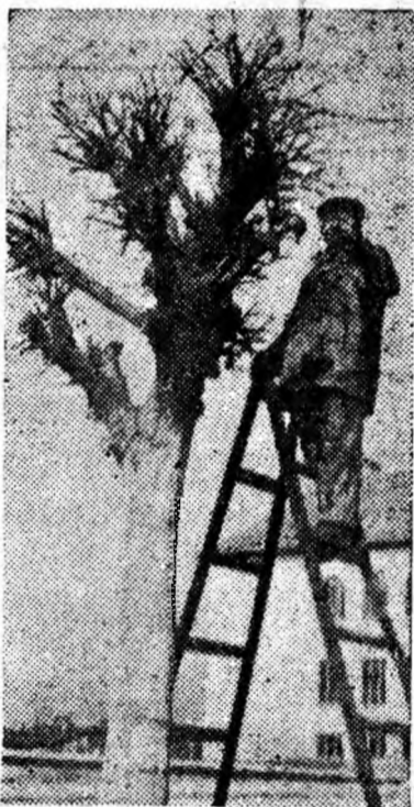
Se face foaieța de primăvară a pomilor și arborilor ornamentali.

Condiții materiale prielnice există: interes, entuziasm din partea oamenilor muncii, de asemenea. Să folosim din plin aceste condiții. O dată cu primele zile ale primăverii, să începem lucrul! Să punem cu toții umărul ca să avem orașe cît mai frumoase, cît mai bine gospodărite.