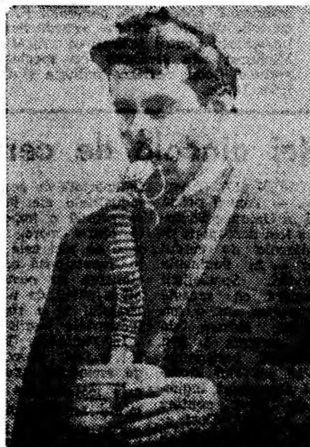
Masca de autosalvare se folosește numai pentru reținerea oxidului de carbon, care poate apărea în cazul incendiilor, focurilor sau exploziilor în subteran.