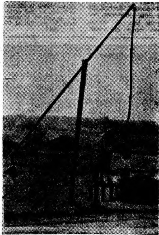
La fîntina cu cumpănă

20 grame. Cu ajutorul ei s-a stabilit că un punct făcut cu creionul pe o bucată de hîrtie cântărește 0,003 mg.