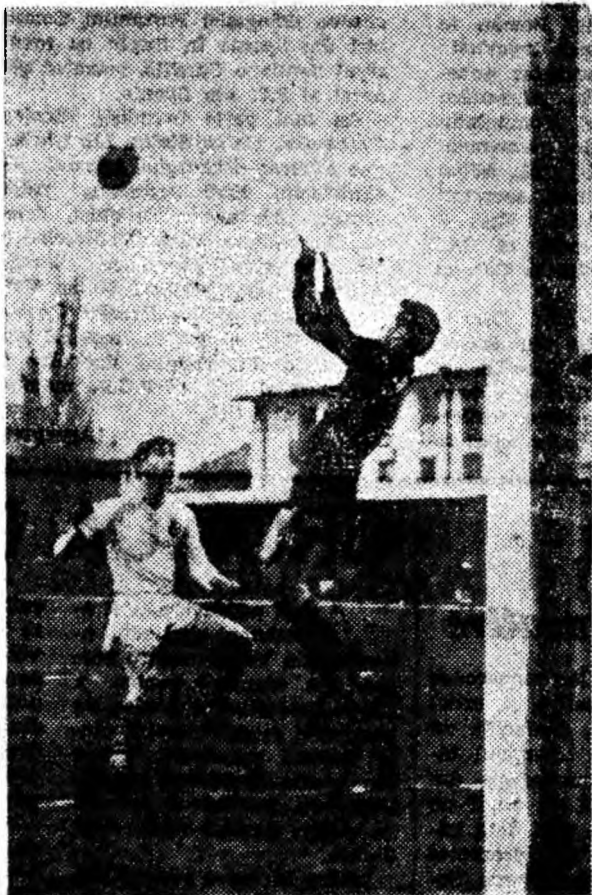
Un nou atac fără rezultat la poarta fotbalistilor din Tg. Mureș.