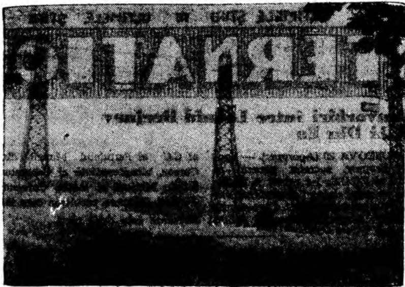
Drum nou cărbunelui aninosean, funicularul Aninoasa Sud — Co-roești. Peisajul e demn de penelul unui pictor.

Îndeplinim rugămintea semnatărilor sesizării și amintim conducerii O.L.F. că are datoria să ia măsuri drastice împotriva unor astfel de „lucrători” care, după cele relatate mai sus, nu cunosc nici civitatea și nici omenia.