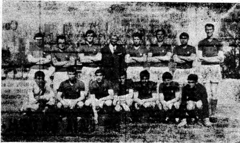
Compenenții echipei Jiul împreună cu antrenorul în fața obiectivului fotografic.

Campionatul categoriei B s-a încheiat. În perioada aceasta de acalmie relativă se fac pregătiri intense pentru începerea noului campionat. Echipa Jiul care peste puțin timp va lua startul alături de formațiile din categoria A, ține să nu-și dezamăgească suporterii. Alături de miile de suporterii din acest bazin carbonifer, avem convingerea că jucătorii echipei noastre vor reprezenta cu cinste fotbalul