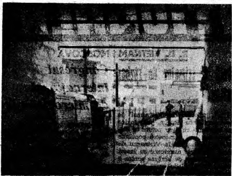
Un nou convol de vagoane goale a pornit spre adâncurile minei Dilja.