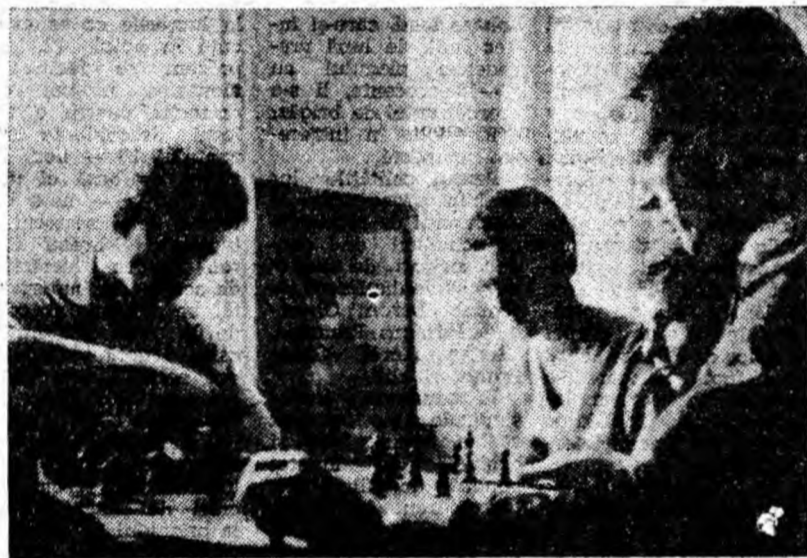
Instantaneu de la clubul muncitoresc — Lonea.