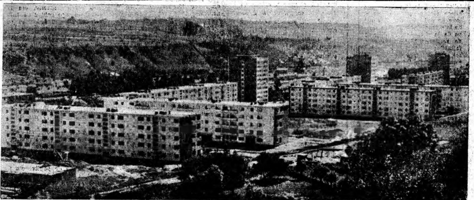
PETRILA: Perle arhitectonice pe malul Jiului transilvănean.