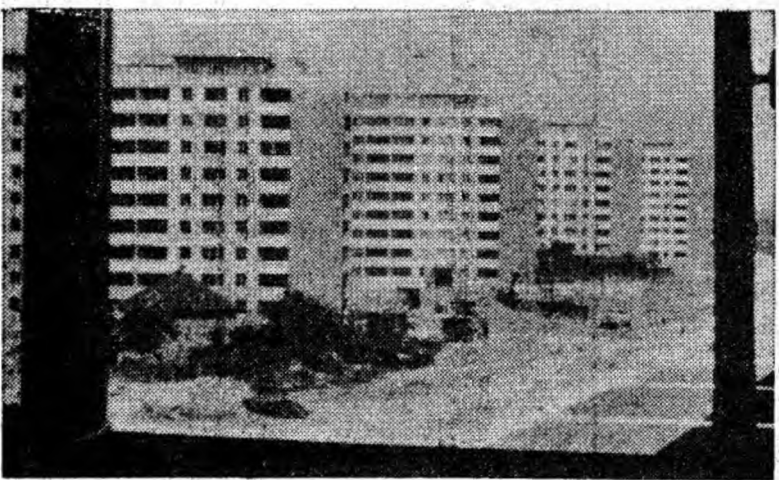
Noi perle în salba arhitectonice moderne a Vulcanului de azi.