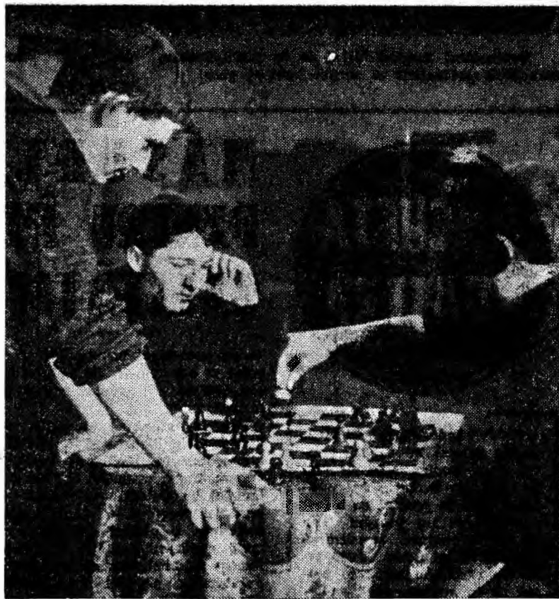
Clubul muncitoresc Aninoasa: O pasionantă partidă de șah.