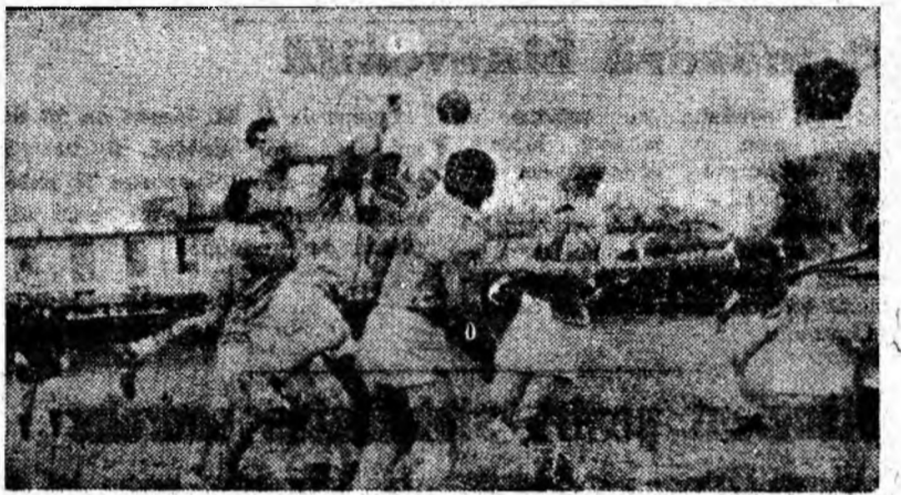
Un buchet de jucători își dispută balonul.