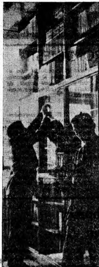
Instantaneu de la biblioteca Grupului școlar profesional din Lupeni.