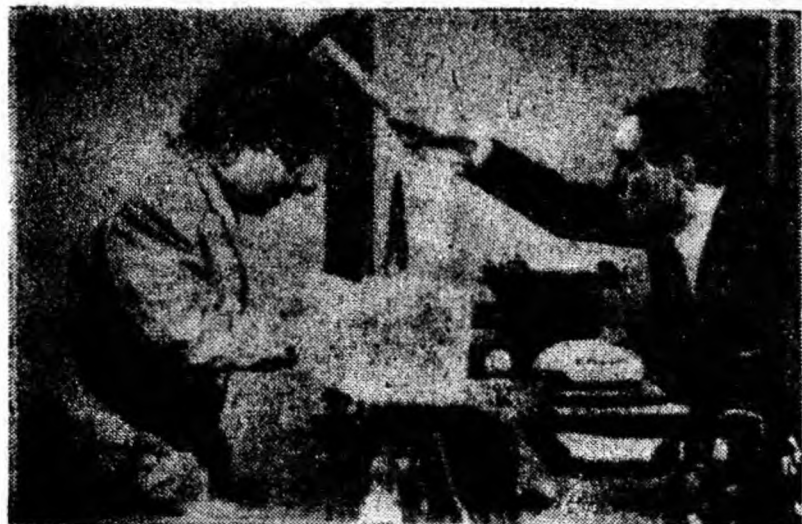
În clipă: O secvență din filmul „YOYO”

Începînd de mâine, ecranul cinematografului „7 Noiembrie” ne oferă spre vizionare o peliculă italiană. Este vorba de filmul „Țara fericirii”, în care vom avea ocazia să urmărim o serie de artiști de seamă ai cinematografului italian, cunoscuți publicului din filmele italiene vizionate.