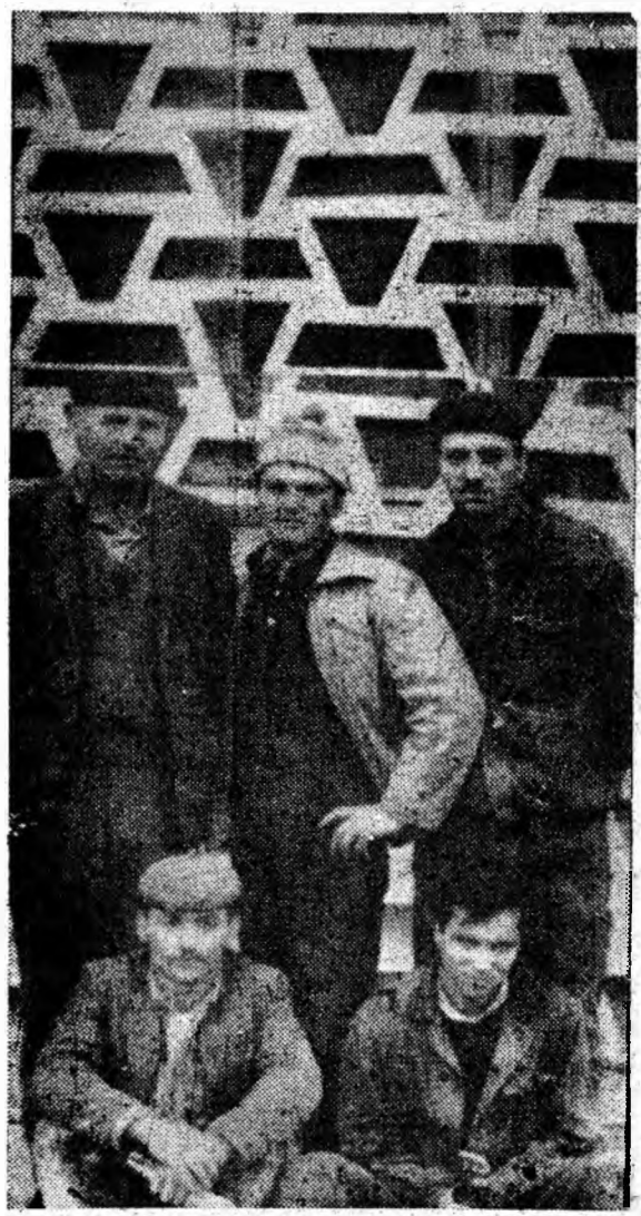
Sau terminat lucrările de finisaj la noul cămin pentru elevii grupului școlar micșer din Petroșani. În acest cămin vor fi cazați 340 elevi, care în afară de dormitoarele ele-