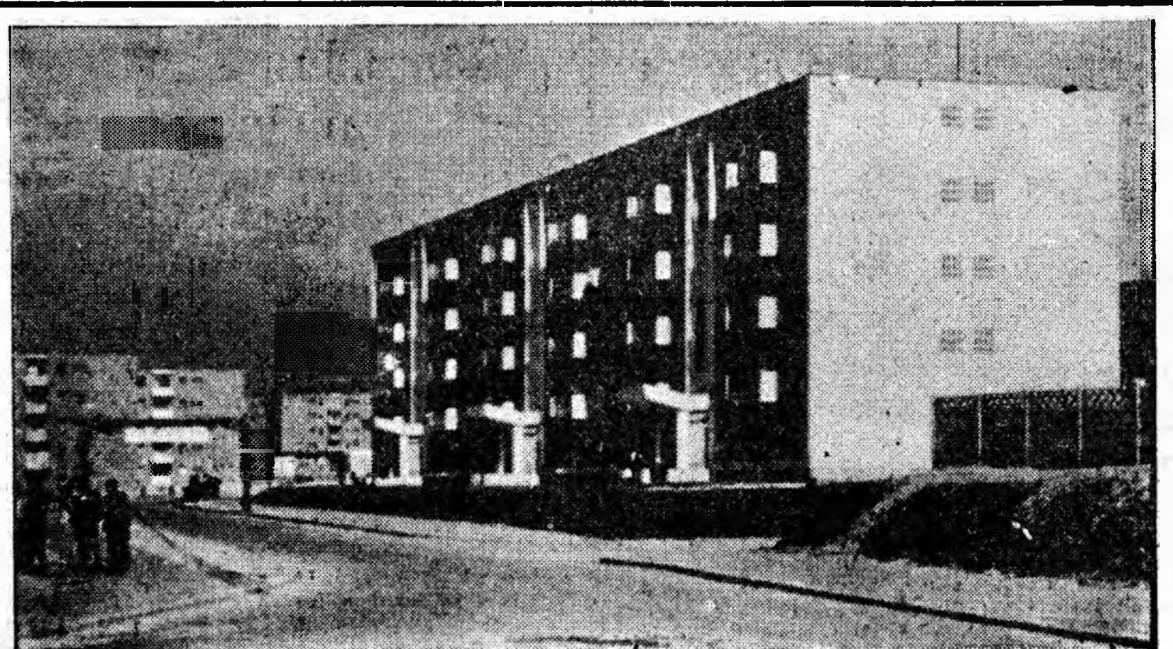
PE INSERAT: În noul cartier de blocuri Livezeni — Petroșani.