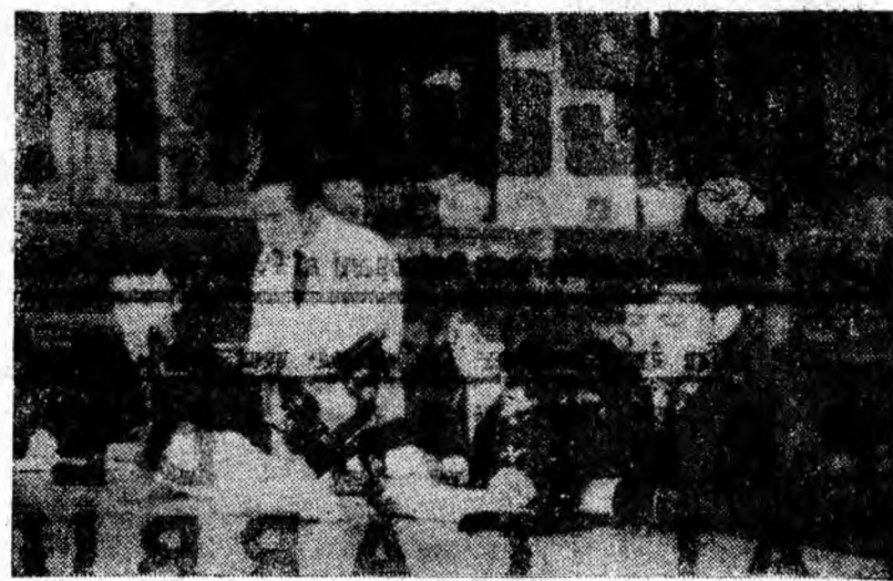
Cîțiva din studenții anului I, secția topografie, la lucrări practice în laboratorul de mineralogie.