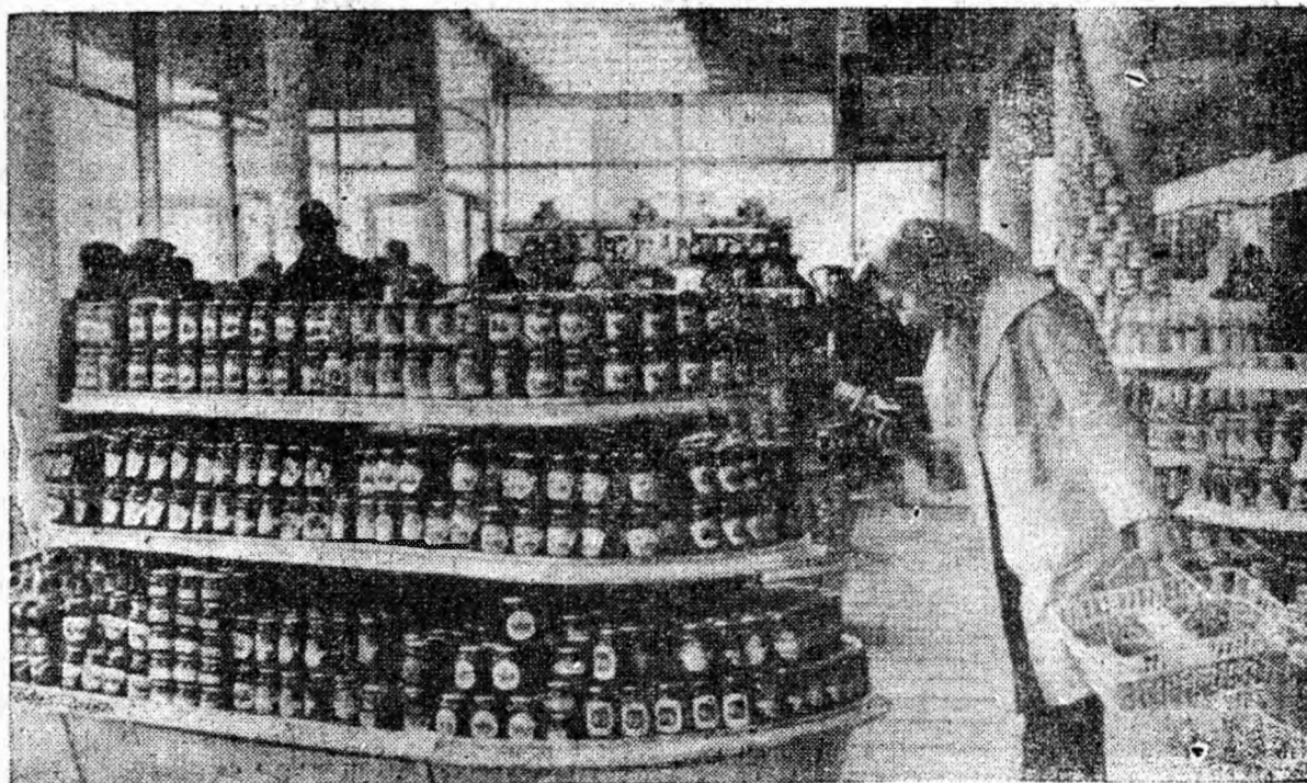
Magazinele alimentare cu autoservire sînt zilnic vizitate de sute de cumpărători care apreciază un sortiment bogat de mărfuri. Clișeu nostru înfățișează un aspect din interiorul magazinului cu autoservire din Lupeni.