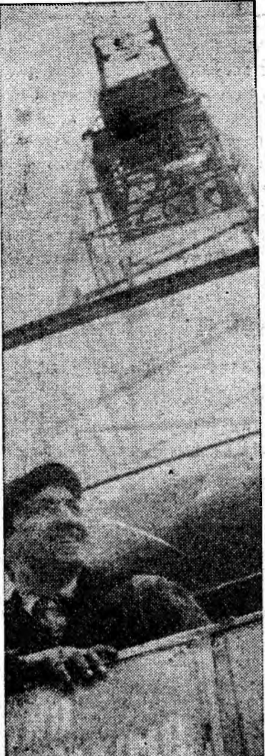
Uteciștii Iordache Samson — unul din cei mai buni macaragii de pe șantierul Vulcan

Prin traducerea în viață a acestor măsuri tehnico-organizatorice, energeticienii din Paroșeni își vor crea condiții pentru a obține noi succese în muncă. Ei s-au angajat că pe 1967 să depășească sarcinile de plan cu 22 500 000 kWh la producția de energie electrică, cu 1 la sută productivitatea muncii, să realizeze 1 200 000 lei economii la prețul de cost și 1 000 000 lei beneficii peste plan.