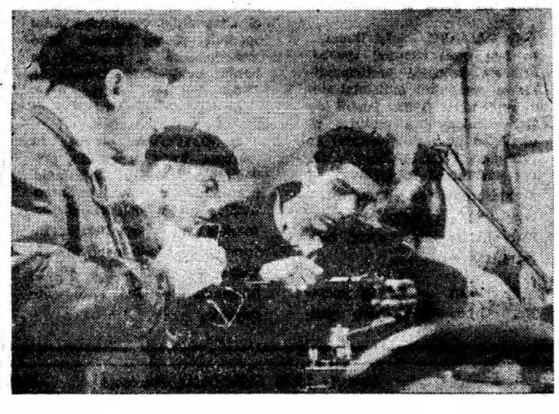
Elevi din anul I ai Școlii profesionale din Petroșani la practică în atelierul de strungărie al școlii.

18,00 Pentru cei mici: A.B.C. 18,20 Pentru tineretul școlar: Neobișnuita călătorie în lumea cărților. 18,50 Publicitate. 18,58 Ora exactă. 19,00 Telejurnalul de seară. 19,20 Buletinul meteorologic. 19,23 Cronica discului. 19,55 Arta plastică. Bienala de pictură și sculptură (II). 20,15 Campionatul european de patinaj artistic. Exerciții libere, perechi. Transmisiune de la Liubliana. 23,30 Telejurnalul de noapte. 23,40 Închiderea emisiunii.