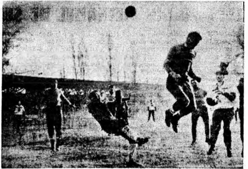
IN CLIȘEU: Aspect din timpul întîlnirii