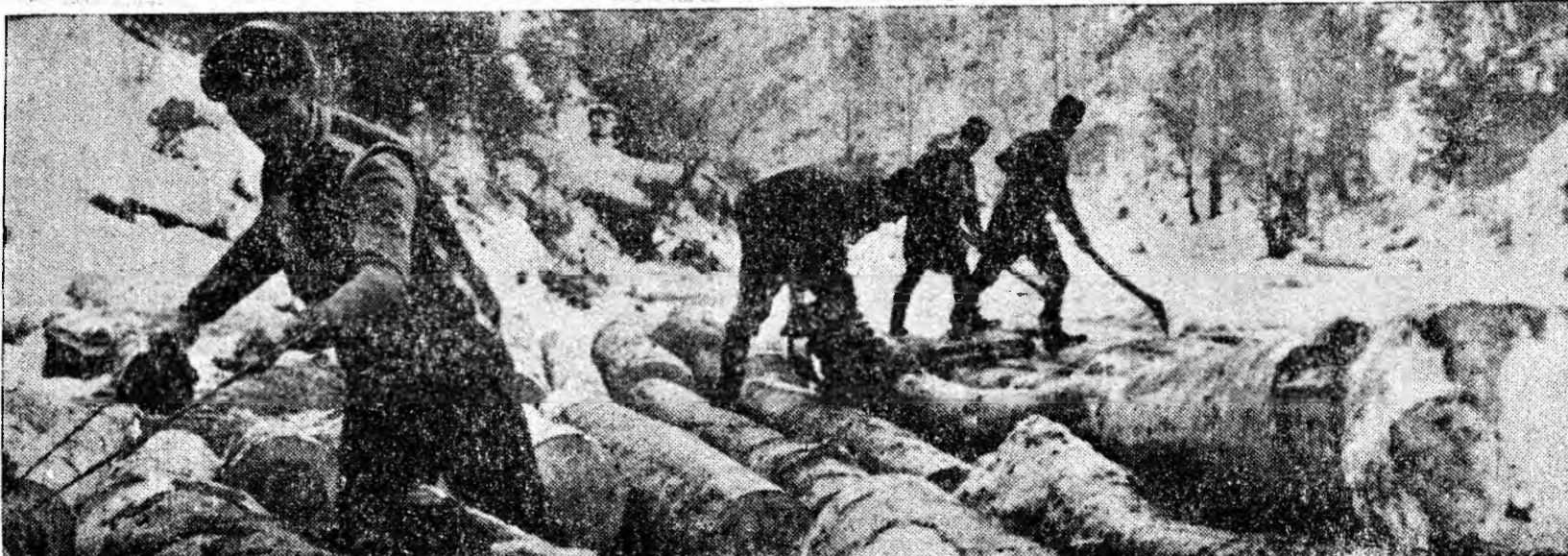
Rampa de încărcare a exploatării Mierleasa, sectorul forestier Lupeni.

● Clubul muncitoresc din Petrița, ora 20: Seară distractivă pentru tineret.