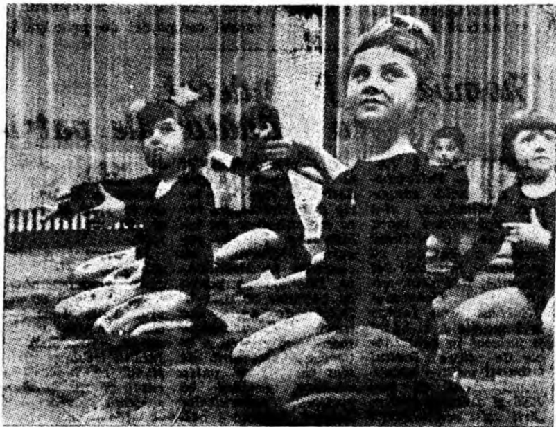
Grația mișcărilor în balet se învață chiar de la primii și cei mai grei pași. Aspect de la o oră de balet la Casa de cultură Petroșani.

Spectacolele vor avea loc în zilele de 8 și 9 martie a.c., orele 17 și 20, în sala teatrului de stat din localitate.