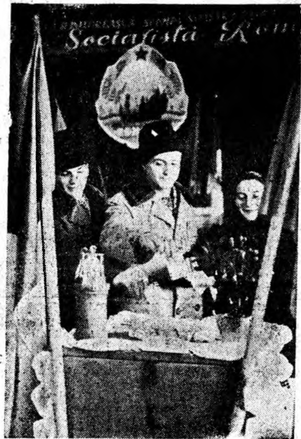
La secția de votare nr. 5 Bănița