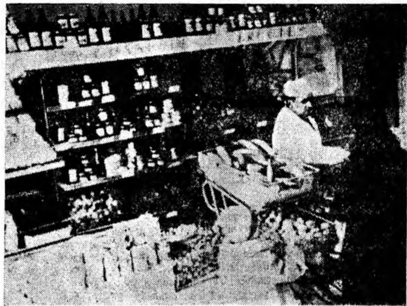
În cartierul Livezeni s-au deschis în acest an două puncte comerciale. Altul se află în construcție. În fotografie — un aspect din unitatea de legume și fructe nr. 20, adăpostită de punctul comercial din strada Independenței.

Cu puțin timp în ur-mă, tura condusă de O-prițoiu Dumitru a fost declarată tură fruntașă în întrecerea socialistă