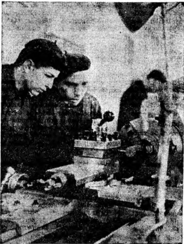
Oră de practică în atelierul de strungărie al școlii profesionale din Petroșani