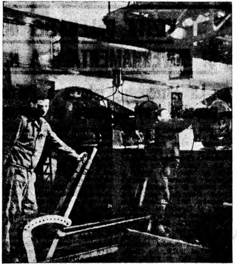
SECȚIA ZEȚAJ DE LA PREPARAJIA LUPENI