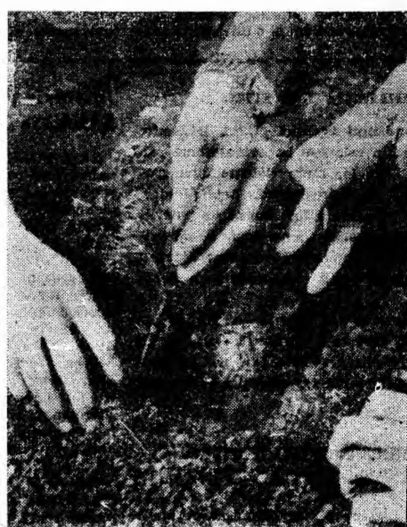
Mîini ajutînd la creșterea viitoarelor păduri