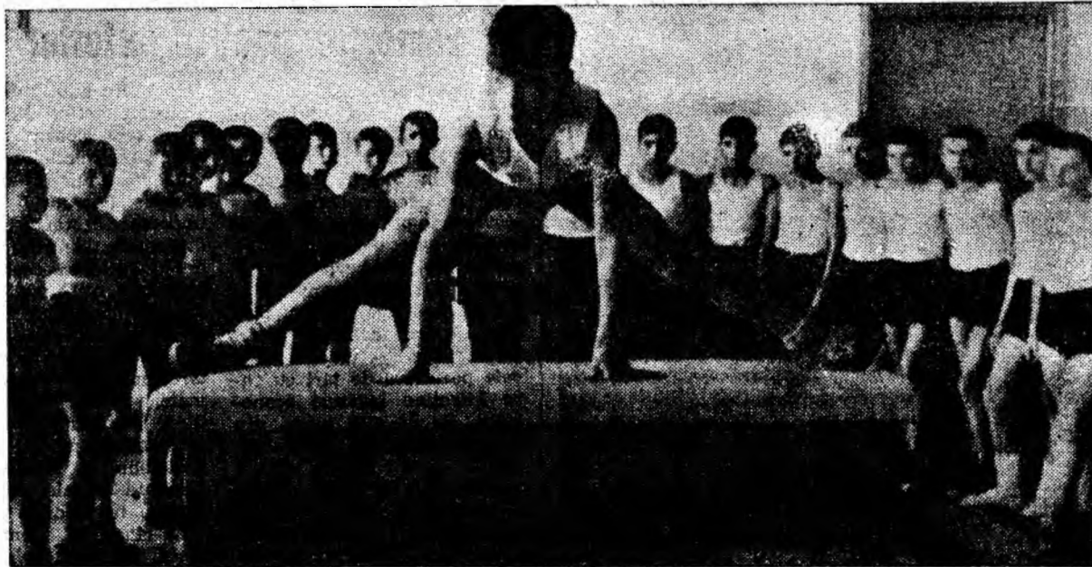
Oră de educație fizică la Școala generală nr. 5 din Petrila.

Trei răspunsuri care dovedesc atenția ce o acordă conducerea unor unități remedierii lipsurilor semnalate prin presă.