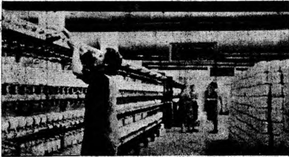
In secția de răsucit de la „Visezoa” Lupeni se lucrează cu spor. Firele de mătase artificială se înfășoară cu viteză pe mii și mii de bobine.