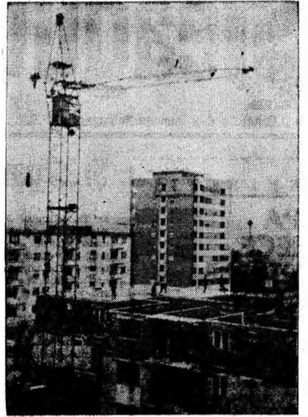
Noi construcții în cartierul 8 Martie din Petrila

N e apropiem de cumpăna anului — sfârșitul primului semestru. Ca și predecesorii săi, și anul 1967 e sortit să imbogățească substanțial zestrea urbanistică a localităților Văii Jiului. Bună parte, adică majoritatea noilor construcții social-culturale, au scadență în primul semestru. Dar sînt onorate termenele de scadență?