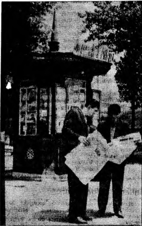
Au sosit zierele proaspete

Cam cîtă ploaie ar trebui să cadă pentru a urni din jurul acestor blocuri jghiaburile vechi și grămezile de țigla spartă? Dar pentru a spăla, o dată pentru totdeauna, neglijența I.L.L.?