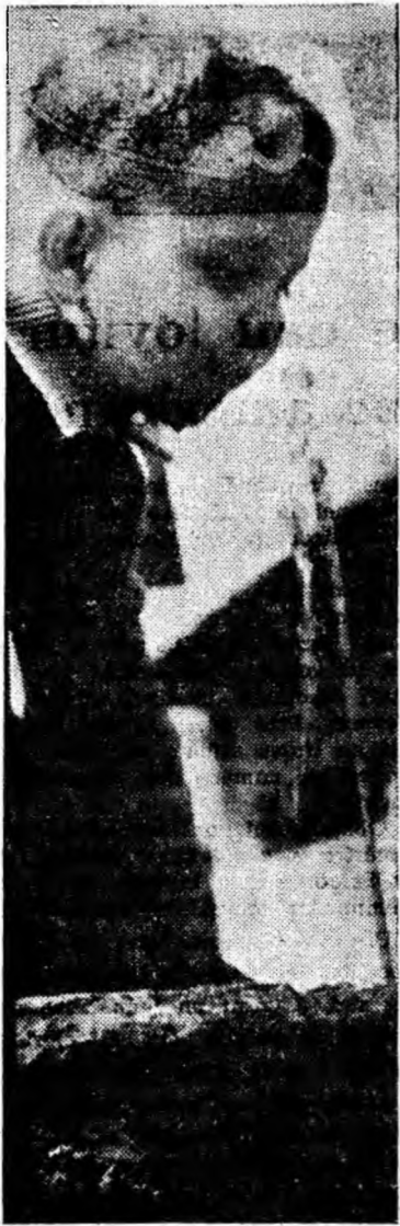
Caniculă... Și ce bună e apa rece!