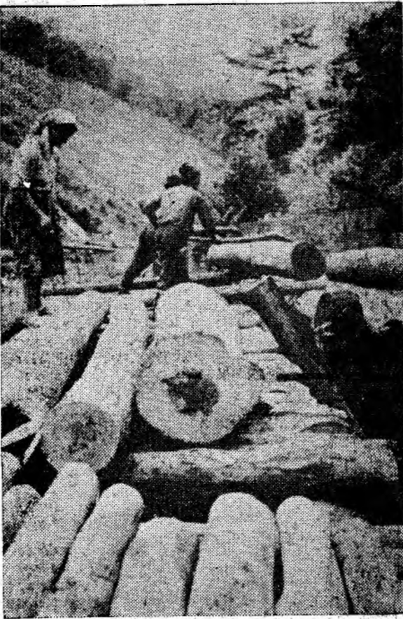
Din exploatarea forestieră Galbina, buștenii de fag sînt aduși pe rampă. Iar de aici, după ce li se face cubarea, iau drumul marilor combinate de industrializarea lemnului