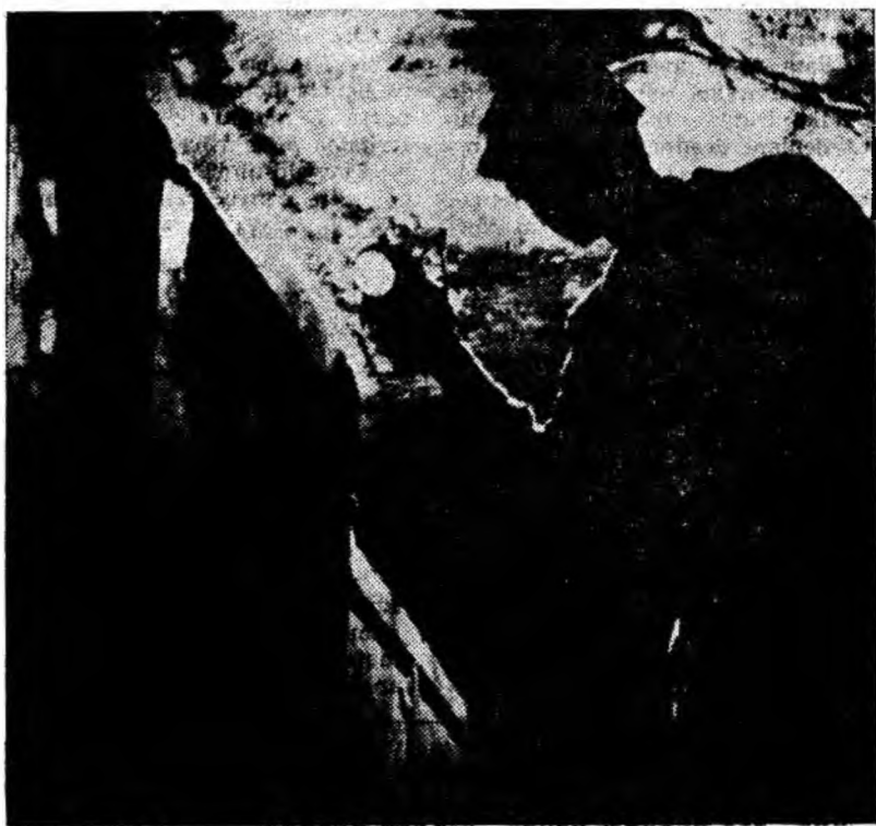
Pe urmele calității cărbunelui în subteran

PETROȘANI — 7 Noiembrie: Printre vulturi; Republica: Denumitorul; LONEA — 7 Noiembrie: Hai Franța!; Minerul: Susana și băieții; ANINOASA: Comușă, seria I-II; VULCAN: Dragostea și moda; LUPENI — Cultural: Jandarmul la New York; BĂRBĂTENI: Credeți-mă oameni; URICANI: Alfabetul friicii.