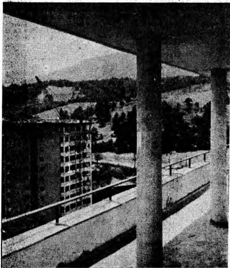
Înălțimile Vulcanului fotografiate de la înălțime