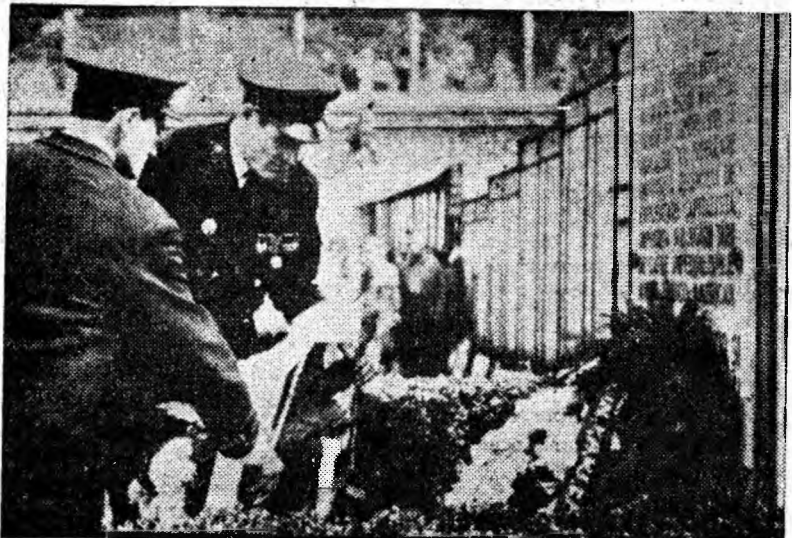
Urmașii eroilor din 1929 depun coroane de flori la placa comemorativă

După solemnitatea de la placa comemorativă de la uzina electri- că, au fost depuse coroane de flori