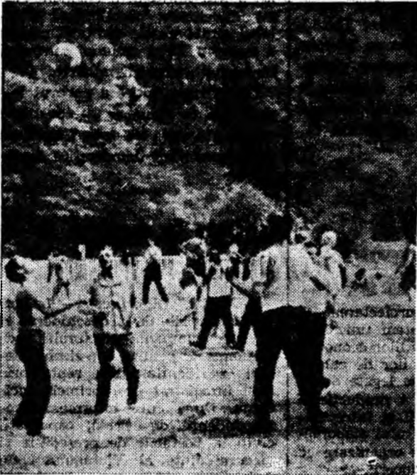
Pajiștea din luncă s-a transformat ad-hoc în teren de sport, loc de plajă și de joacă pentru mic și mare

Inserarea i-a readus pe sărbătoriți în oraș unde, la club, a continuat veselie pînă tîrziu, la o seară cultural-distractivă urmată de dans.