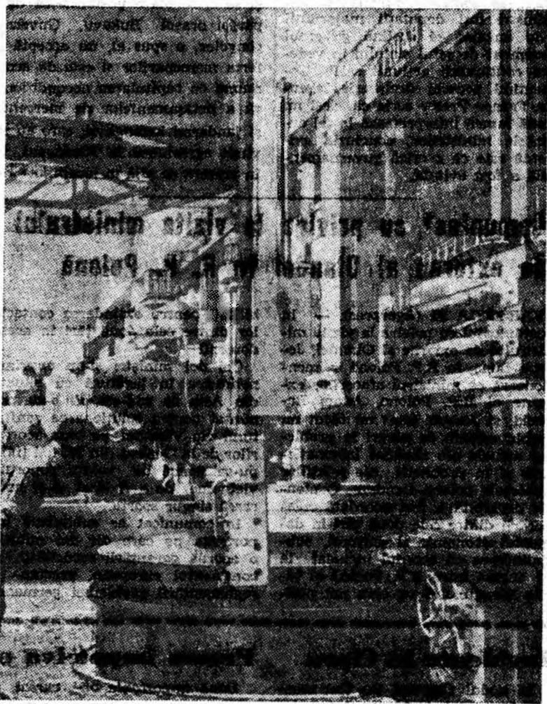
U.R.U.M.P. De curînd, în secția mecanică a uzinei a fost montat un nou strung Carusel cu diametrul de 2500 mm. IN CLIȘEU: Se lucrează prima piesă la noul strung.

înainte de termen instalarea celor două ventilatoare noi cu care a fost dotată secția și care sint menite să asigure condiții mai bune de aerisire în filatură. La stația de neutralizare a apelor reziduale o altă echipă condusă de Hai Ioan face ultimele finisări în vederea asigurării punerii în funcțiune a stației la termenul planificat. Ca să nu rămînă în urmă, și lucrătorii care fac repararea planșeului secției filatură depun eforturi susținute să termine porțiunea de planșeu dintre și de sub mașinile de filaj cu nr. 16 și 17 ca acestea să poată fi repute în funcțiune cit mai curînd. Cu astfel de preocupări și reaiizări a împlînat colectivul secției filatură marea sărbătoare a poporului nostru — 23 August.