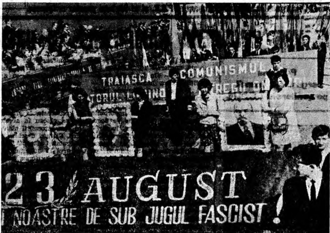
Tineri ale căror visuri prind aripi, datorită vieții libere pe care o trăim, defilează în fața tribunei purtînd portretele lui Marx, Engels, Lenin, pancarte precum și steaguri roșii și tricolore.

muncitorilor ceferiști. Fiecare ceferist poartă garoafe roșii. Spre tribună a zburat un buchețel de garoafe, apoi altul urmat de o adevărată ploaie de flori. Din tribună li se răspunde demonstrațiilor din coloană tot cu flori. E un adevărat zbor al florilor ce nu a încetat decît la terminarea demonstrației. Tribuna, strada principală, totul s-a transformat într-un covor de flori uriaș. Peste tot flori; așa cum este astăzi în patria noastră viața tuturor celor ce muncesc, înfloritoare, fericită.