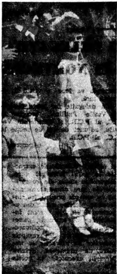
Sub faldurile purpurii ale drapelului partidului demonstrează reprezentanții viitoarei generații de fărîțori ai socialismului.

S-au încins zeci de jocuri de volei și fotbal. Toți de-a valma, nepoții și bunicii. Pînă și femeile au jucat fotbal, unele dovedind chiar talent în ale sportului cu balonul rotund. După atîta alergătură se răcoeau bălăcîndu-se în apa cristalină a Tăii. Privindu-i te gîndeai: ce bine ar fi să se amenajeze aici, pentru la anul, un mic bazin pentru baie.