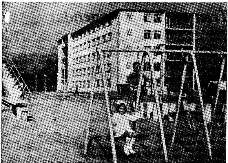
Cînd cei mari — gospodarii localităților — se îngrijesc de amenajarea locurilor de joacă în noile cartiere, bucuriile copilăriei sînt mai numeroase

PETROȘANI — 7 Noiembrie: Cartea de la San Michele; Republica: Compartimentul ucigașilor; Petrița: Cheile curului; LONEA — Minerul: Jandarmul la New York; LUPENI — Cultural: Zodia fecioarei; BĂRBĂTENI: Reîntorcerea pe pămînt; URICANI: Cimaron; PAROȘENI: Lumea minunată a fraților Grim.