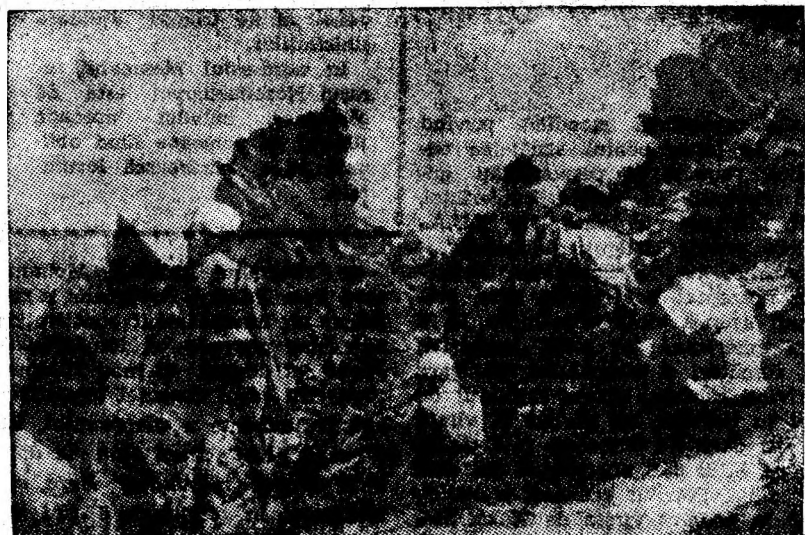
În excursie prin Retezat

15,00 BULETIN DE ȘTIRI. Buletin meteorologic; 15,20 Fragment de spectacolul „Măsuratul oilor” susținut de Ansamblul folcloric al regiunii Banat; 15,30 Ari din opere; 15,50 Cîntece cu și fără cuvinte; 16,00 RADIOJURNAL. Sport. Buletin meteorologic; 16,30 Șlagăre. Șlagăre; 16,50 Din cîntecele și dansurile popoarelor; 17,10 Melodii distractive; 18,00 BULETIN DE ȘTIRI; 18,05 RADIOSIMPOZION: „FUNCȚIILE ETICE ALE COLECTIVITĂȚII”; 18,25 Melodii de Petre Mihăiescu și Aurel Manolache; 18,40 Incursiuni în cotidian; 19,00 Concert de melodii românești; 19,30 „LA ÎNCEPUT DE AN ȘCOLAR”. Vorbește acad. Ștefan Bălan, ministrul Învățămîntului; 19,40 Varietăți muzicale; 20,00 RADIOGAZETA DE SEARĂ. Cronica economică; 20,30 Muzică ușoară; 20,50 Cîntă Tita Bărbulescu și Ion Blăjan — muzică populară; 21,05 ANTENA TINERETULUI; 22,00 RADIOJURNAL. Sport. Buletin meteorologic; 22,15 Intilnire cu jazz-ul; 22,45 MOMENT POETIC; 23,00 Muzică ușoară; 24,00 BULETIN DE ȘTIRI; 0,05 Melodiile nopții. 2,55-3,00 RADIOJURNAL.