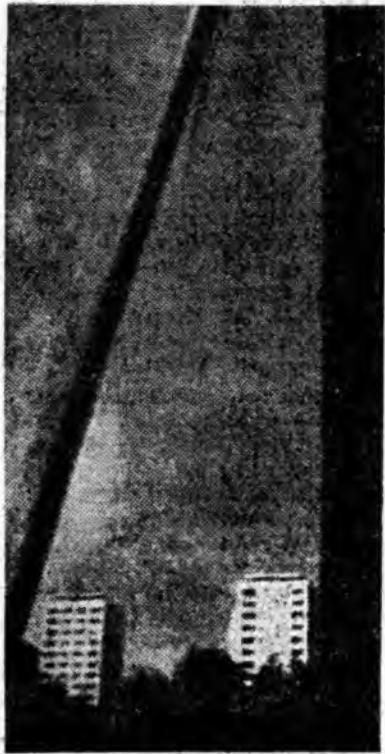
O poartă deschisă spre oraș, spre eleganța și arhitectonica clădirilor