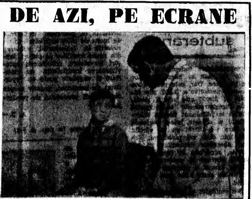
O secvență din filmul „Copiii lui don Quijote“

Muncim din răspuțeri pentru a ne face viața mai frumoasă, mediul în care trăim mai plăcut, mai armonios. De ce să tolerăm lipsa de respect la adresa societății, a noastră, a tuturor?