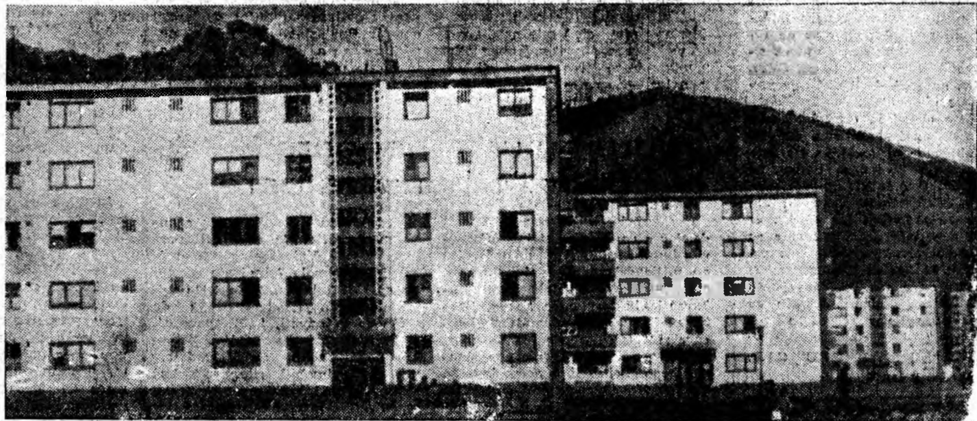
Peisaj arhitectonic pe fond montan în noul oraș Petrila.

Noile abataje vor fi înzestrate cu puternice transportoare de fabricație românească care vor permite mecanizarea transportului de cărbune în subteran. Primele abataje vor intra în funcțiune la începutul anului viitor.