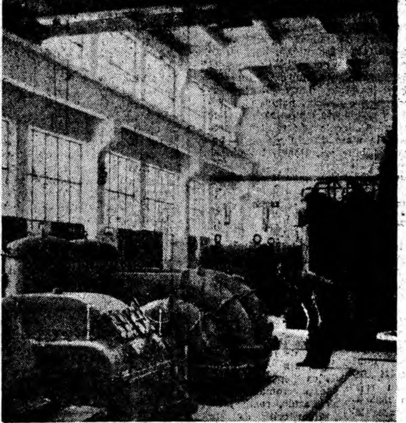
E. M. URICANI: HALA TURBOCOMPRESOARELOR