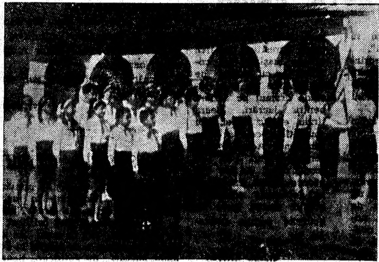
Moment solemn. Pionierii detașamentului nr. 3 de la Școala generală nr. 1 Petrila, își aleg noul colectiv de conducere.

teratura română, matematică, științele naturii, fizică, chimie etc. Echipajul se cere să fie pregătit încît să răspundă cu precizie și rapiditate la întrebările formulate de comisia examinatoare. Concursul se ține pe etape la care participă cîte trei orașe și va fi transmis la posturile de radio. Ordinea întrecerii între orașe a fost stabilită prin tragerea la sorți. Unită-