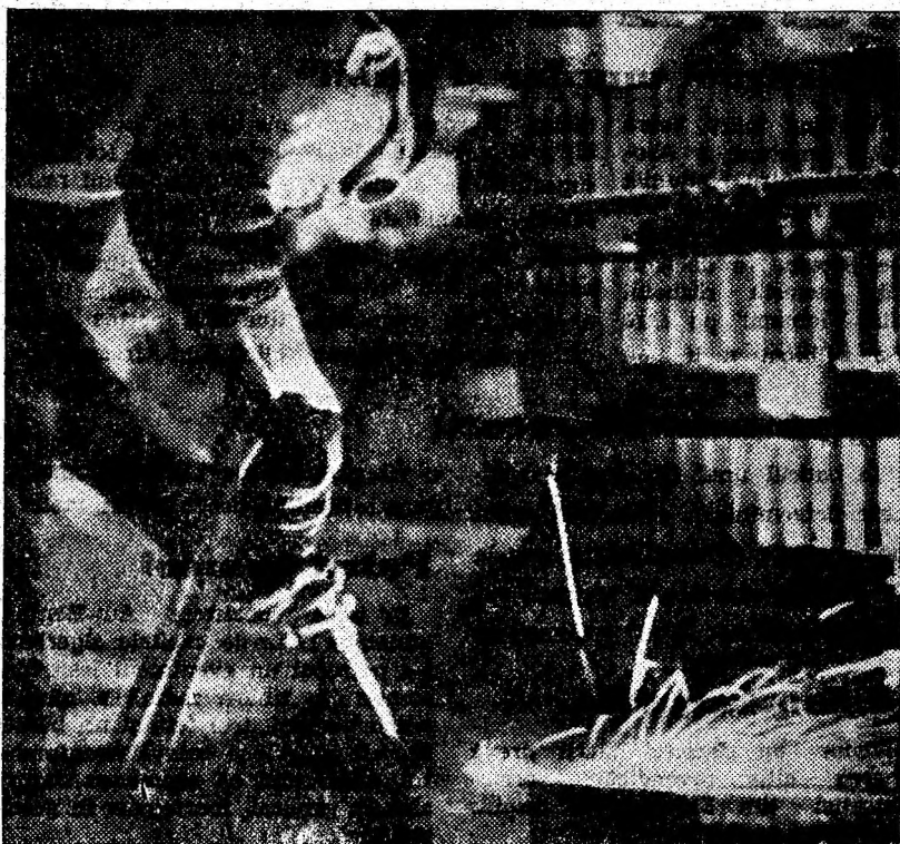
În secțiile URUMP se assemblează prin sudură o largă gamă de utilaje miniere. De aici ele sînt trimse exploatarelor carbonifere din Valea Jiului.