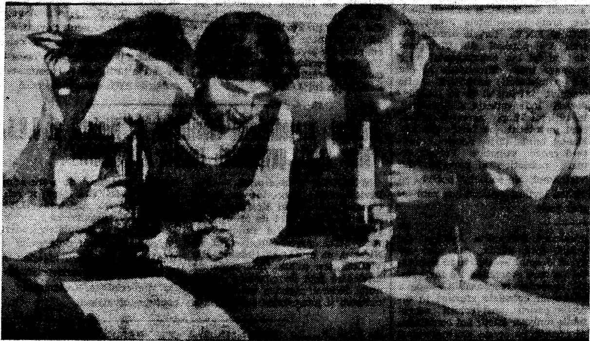
Oră practică în laboratorul școlii. Privind la microscop și notind caracteristicile microorganismelor cercetate, lecția teoretică se va „sedimenta” mult mai clar în mintea elevilor.

Cerimile eficienței economice ridicate a activității întreprinderilor, utilizarea rațională a utilajelor și instalațiilor, fără întreruperi, fără avarii, introducerea continuă a tehnicii noi impune o altă viziune asupra cursurilor de calificare, caracterizată prin exigență, prin grija pentru asigurarea unui nivel corespunzător de pregătire profesională!