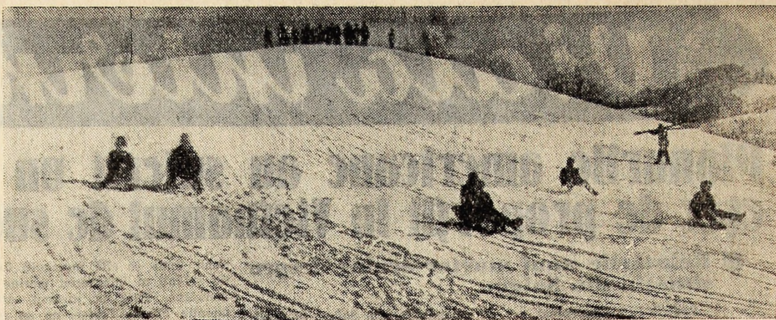
La vale — ca vîntul. La deal e ceva mai greu