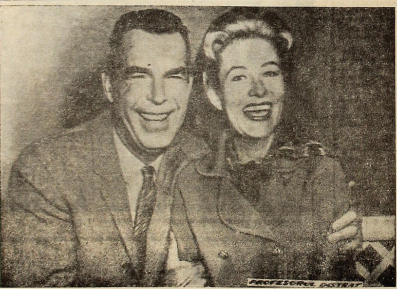
Fred Mac Murray și Nancy Olson în „Profesorul distrait” — film ce va rula, între 16 și 20 martie, la cinematograful „Cultural” din Iupeni.

— M-am săturat, Anda dragă, nu mai pot. Și tu nu pricepi nimic, dar cînd vezi creștea mai mare un să-ți povestesc.