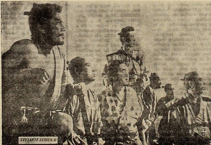
Servetă din filmul „Cei șapte samurai”.

el te fascinează prin felul în care sînt redate caracterele eroilor. Acest film despre samurai nu este departe de viața contemporană. El pare îndesat datorită exotismului, luptelor sale spectaculoase, excelențelor sã actori, dintre care se detașează vedeta ecranului japonez Toshiro Mifune.