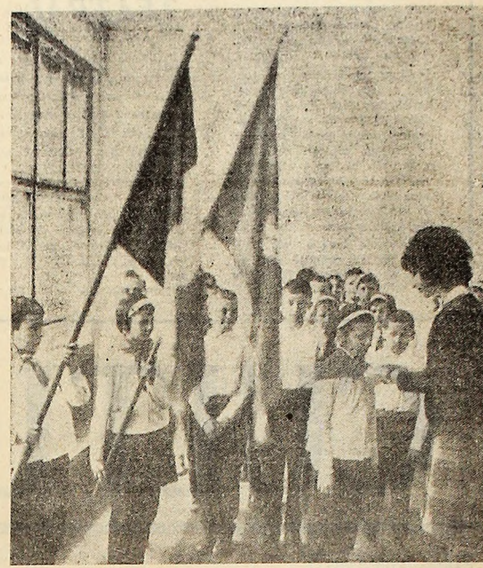
Cu câteva zile înainte de vacanță, rîndurile pionierilor de la Școala generală nr. 5 Petrița s-au marit.

Ar fi nenumărate exemple care se pot da în acest sens. Conducerea minei și conducerea sectorului vor trebui să urmărească mai îndeaproape activitatea echipelor care execută reviziile și reparațiile diferitelor utilaje. Stimulentele materiale trebuie să aibă la bază timpul în care se execută o reparație și calitatea acesteia.