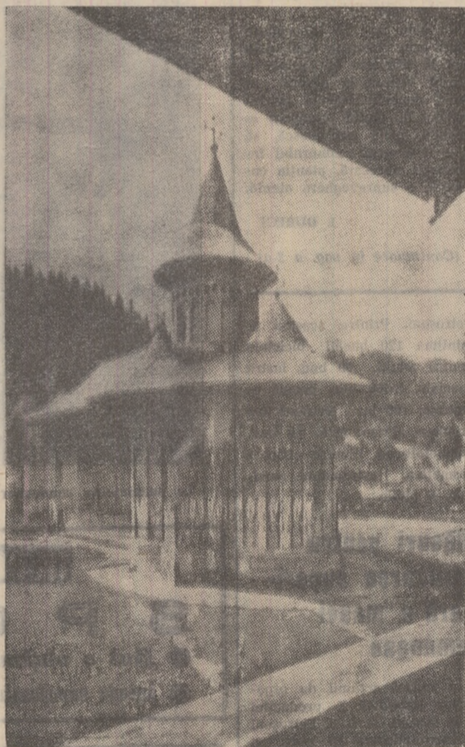
Mănăstirea Voroneț, monument al artei seculare din țara de sus, un obiectiv turistic de mare atracție în acest termecător colț al țării noastre.

Deși avid, limbajul citirelor conturează totuși sugestiv noile dimensiuni ale țării de Sus.