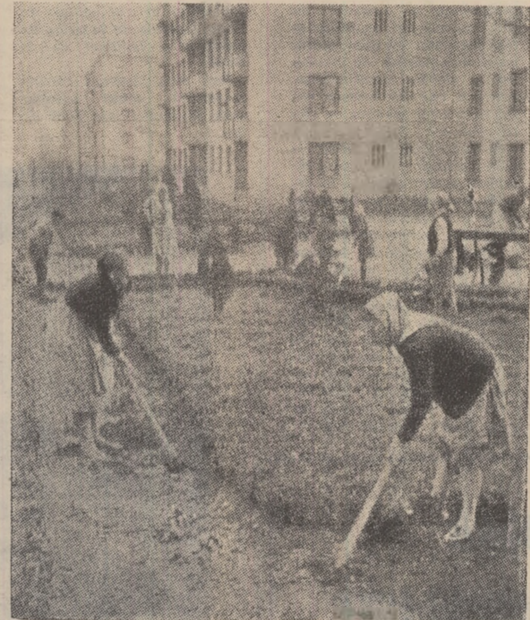
La amenajarea rondurilor de flori (Instantanul din orașul Vulcan).