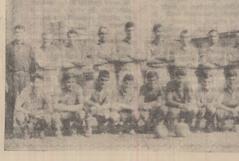
Echipa de fotbal Știința Petroșeni.