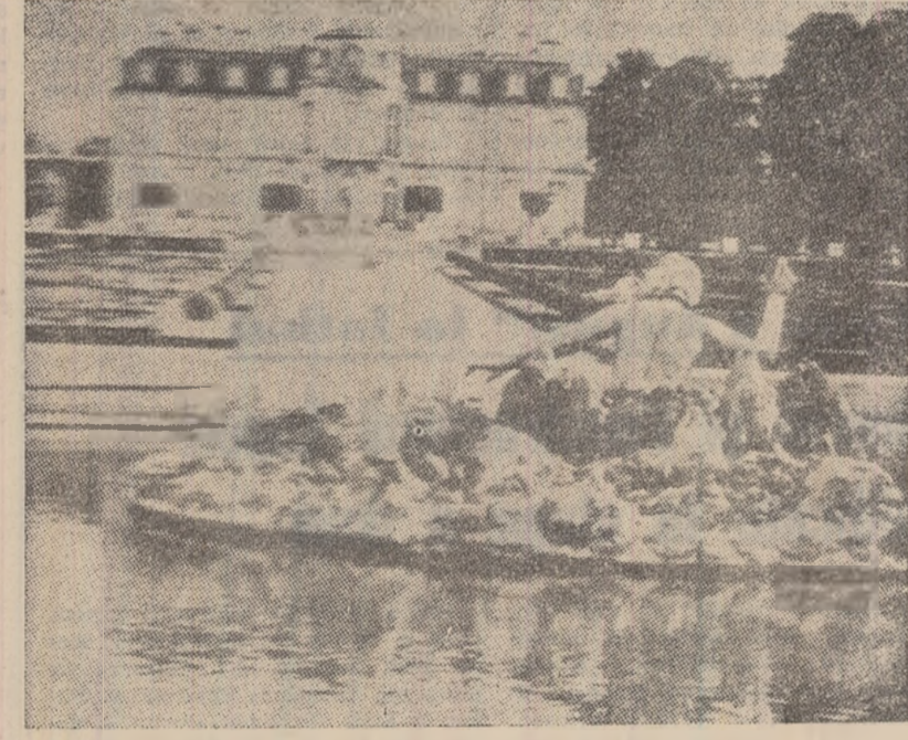
FRANȚA. — Castelul Champs, de lângă Paris.

Încă de la începutul anului presa americană prevestea că vara lui 1968 va fi o „vară fierbinte”. Mai mulți lideri ai populației de culoare, printre care și Martin Luther King, au avertizat autoritățile că în