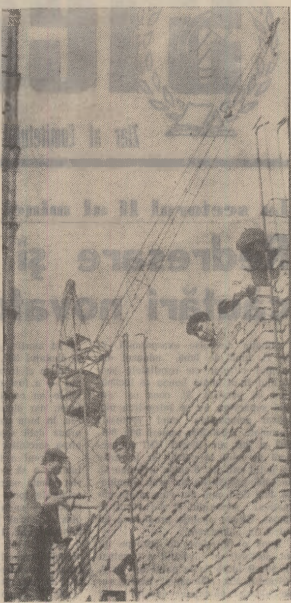
Construcția liceului din Vulcan se desășoară într-un ritm susținut. Foto-reporterul nostru a surprins în imagine o parte din brigada de zidari condusă de Miștea Marin.

În acest fel, colectivul grupului de șantier a reușit să respecte indicația de a realiza 25 la sută din planul fizic de producție al anului.