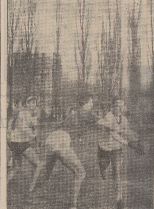
Aspect de la recentul meci internațional prestat de echipa de handbal S.S. Petroșeni în compania cuosenilor echipei germane Halloren — Halle.