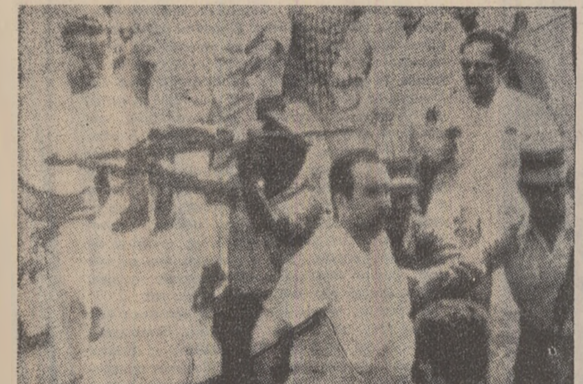
VENEZUELA. Maracaibo, marele centru petrolifer al Venezuelei, a fost ocupat de forțele armate și izolat de restul țării, după violentele incidente care s-au produs acîntre muncitorii greviști și poliție. Greviștii alăturîndu-li-se și studenții din Maracaibo. IN FOTOGRAFIE: Pe străzile din Maracaibo.

BOGOTA. — În Columbia s-au semnalat noi acțiuni ale forțelor de partizani. Potrivit unui comunicat oficial, în cursul unui puternic angajament între trupele guvernamentale și partizani s-au înregistrat 14 morți și un număr mare de răniți, de ambele părți.