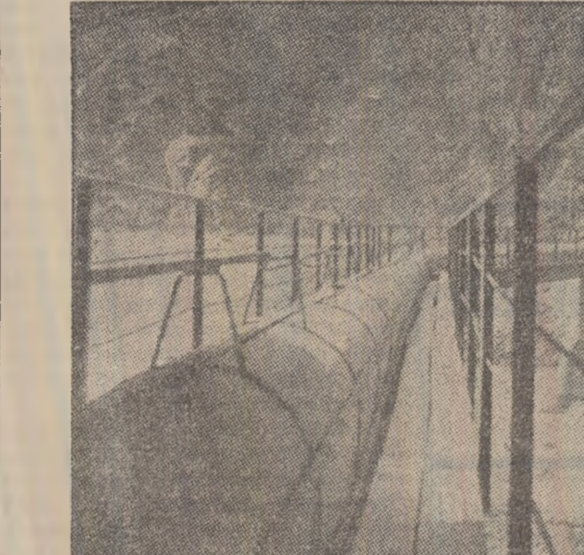
Conducerea de apă de la Izvorul la preparata din Coroștii se întinde pe mulți kilometri. Pentru a traversa Jiul a fost nevoie de un adevărat pod al... conductei.