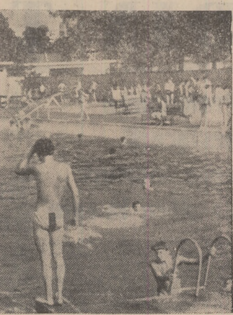
S-a deschis ștrandul termocăld „Preparatorul” din Lupeni (în fotografie).

Întîlnind duminică, în cadrul Cupei Rosu (două încercări), Dobroiu (două încercări), Tripon și Munteanu (cîte o încercare), — transformate impecabil de Balas, Szilveszter stabilește rezultatul final printr-un excelent drobgoal.