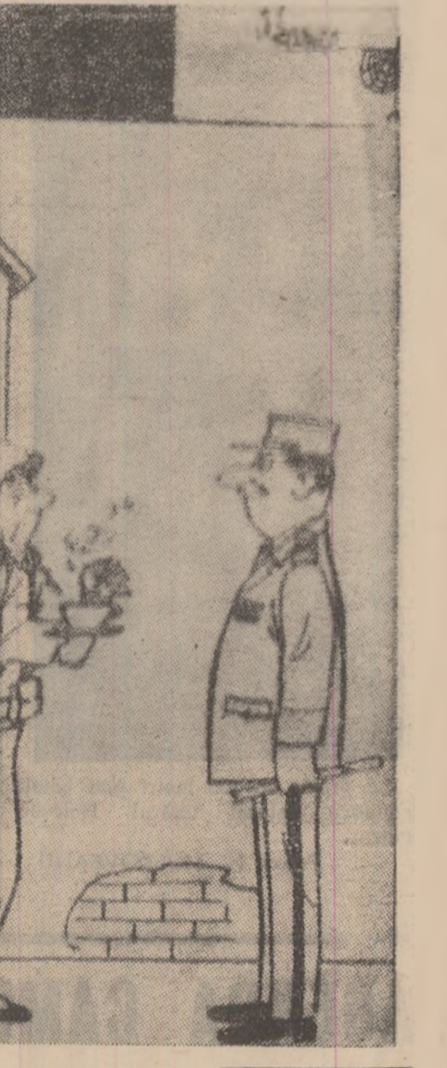
UMOR DIN PRESA VEST-EUROPEANA. — „Tîi să nu adorm!”

și din numeroase alte date obținute prin explorarea sateliților naturali ai Pămîntului rezultă că solul lunar, asemănător prin structură cu bazaltul, va constitui el însuși un „blindaj” sigur pentru apărarea exploratorilor Lunii de radiațiile cosmice. Un grup de cercetători sovietici a stabilit experimental că o încăperă construită din rocă lunară cu grosimea de 75-100 centimetri garantează o protecție sigură pentru oamenii timp de mai mulți ani.