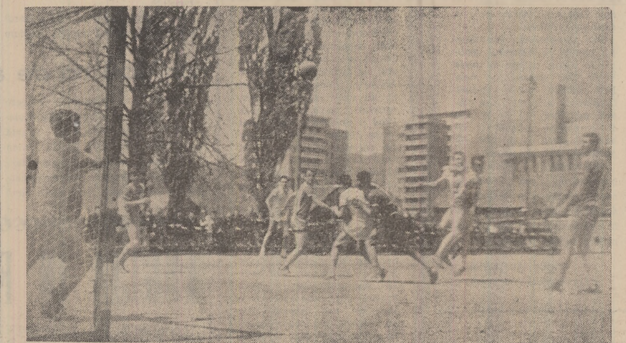
Șut și... un nou gol pentru echipa Știința.